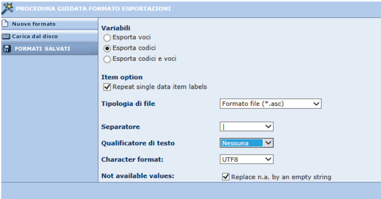
Figura 4: Opzioni di esportazione