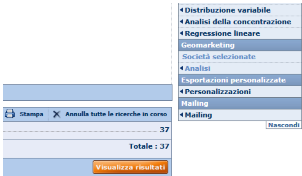
Figura 2: Esportazioni personalizzate