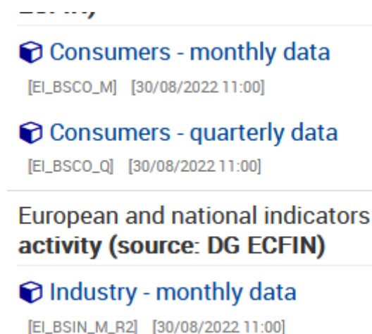
Figura 1 – Come reperire il nome di un database

Per scaricare un database serve conoscere il suo nome, sul sito è indicato tra parentesi quadre come si vede in figura 1 dove sono elencati i database EI_BSCO_M , EI_BSCO_Q ed EI_BSIN_M_R2 .